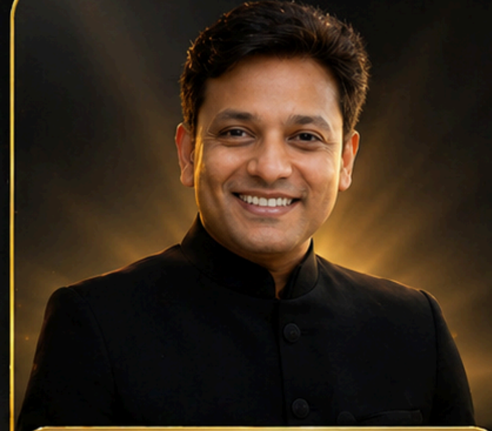
ಶ್ರೀ ಅಮಿತ್ ಚೌಧರಿ